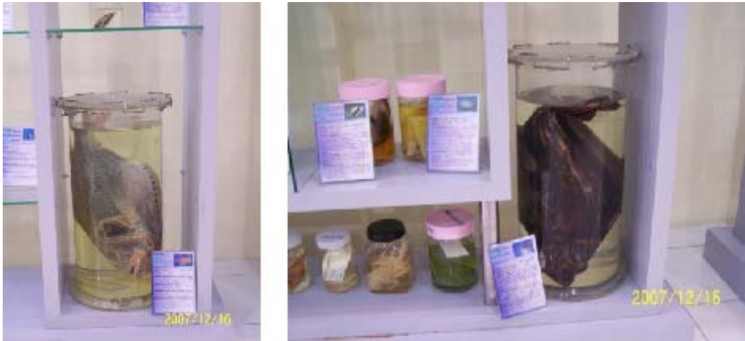
... ... ... 20 ...