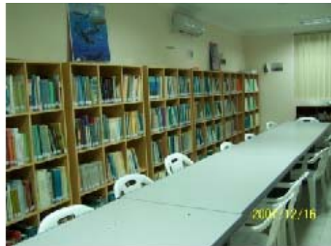
דברים בסיסיים שיש להכירם לפני שאתם מתחילים - 2007 בית הספר הריאלי, ירושלים