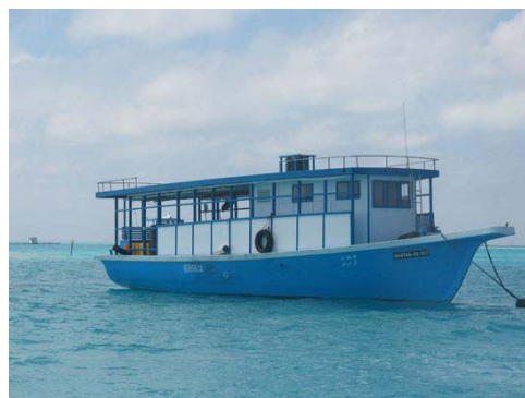
图 1 左 为 科 考 船 号 6，右 为 科 考 船 号 7。