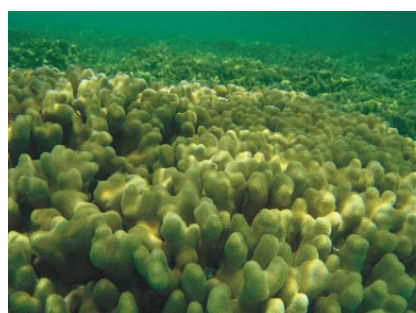
... 2006 ...